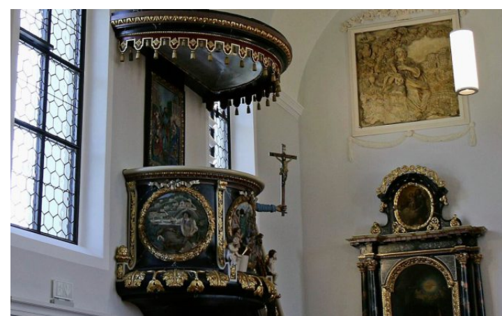
Das Kanzelkreuz sticht markant heraus.

Die Möblierung der Kirche markiert das Ende der Sanierungsarbeiten. Die letzten Details: Polster werden auf die Holzbänke gelegt, Kirchenschmuck angebracht. Zudem wird das Kanzelkreuz aufgehängt.