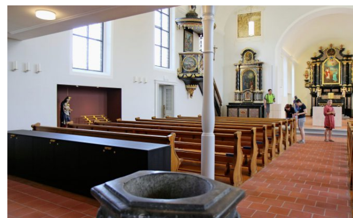
Der ehemalige Taufstein wird zum Weihwassergeschirr umfunktioniert.